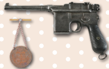
東江縱隊的駁殼手槍 及抗日救國紀念章