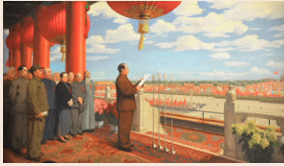
「開國大典」油畫（官方複製品）