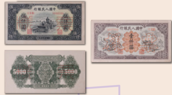
中國人民銀行首次發行的人民幣 1,000元及5,000元鈔票樣本