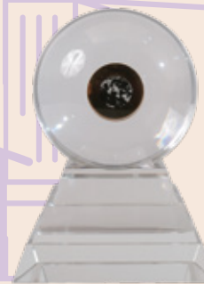
「明月照我還」月球土壤