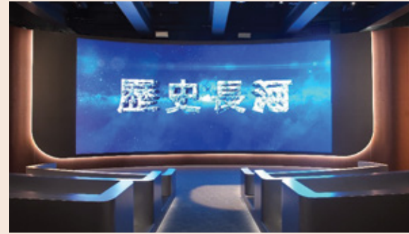
「歷史長河」動感影院