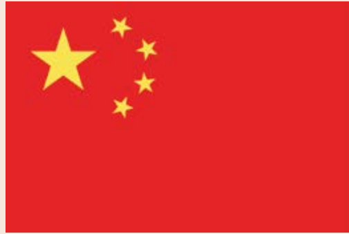
《香港國安法》公布實施當日在 天安門廣場飄揚的國旗