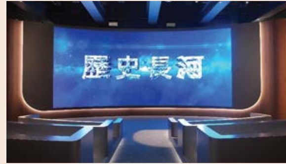
「歷史長河」動感影院