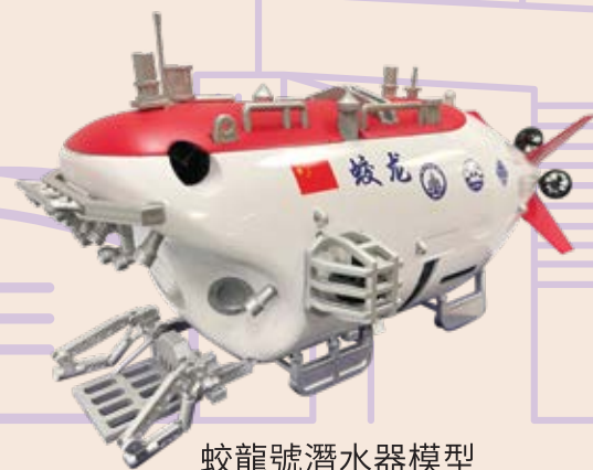
蛟龍號潛水器模型