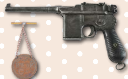
東江縱隊的駁殼手槍 及抗日救國紀念章