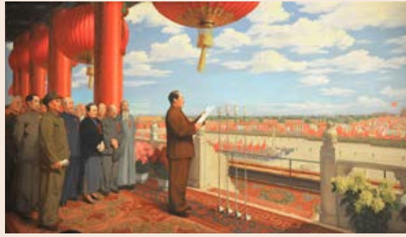
「開國大典」油畫（官方複製品）