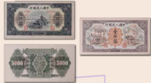
中國人民銀行首次發行的人民幣 1,000元及5,000元鈔票樣本